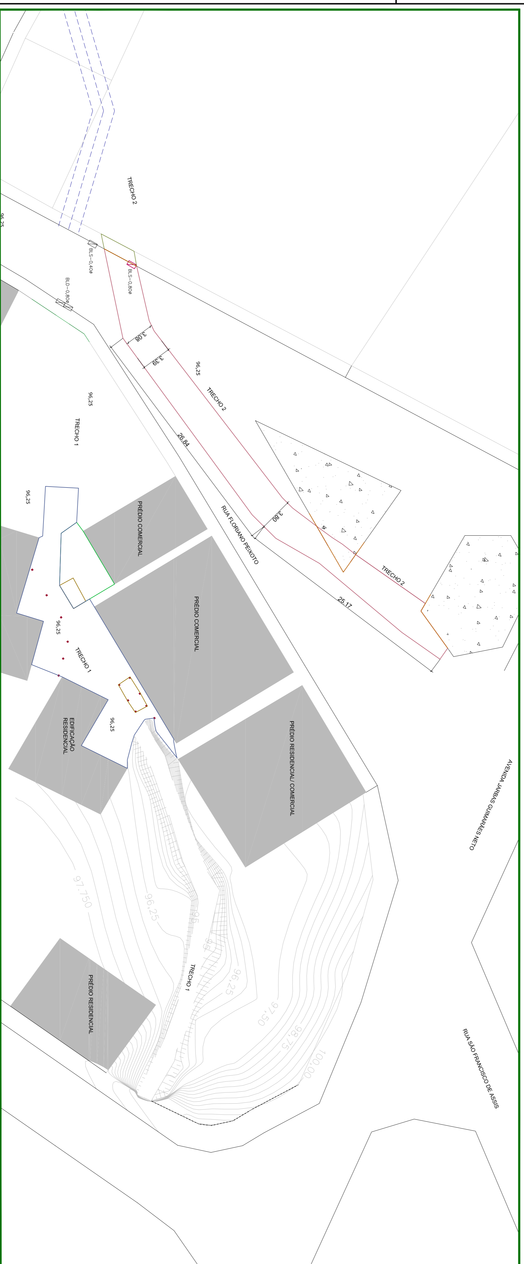
PLANTA DE IMPLANTAÇÃO - TRECHO 1 e 2 - Escala: 1/250